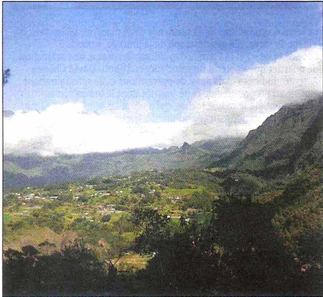
Des sorties à caractère sportif sont également organisées.