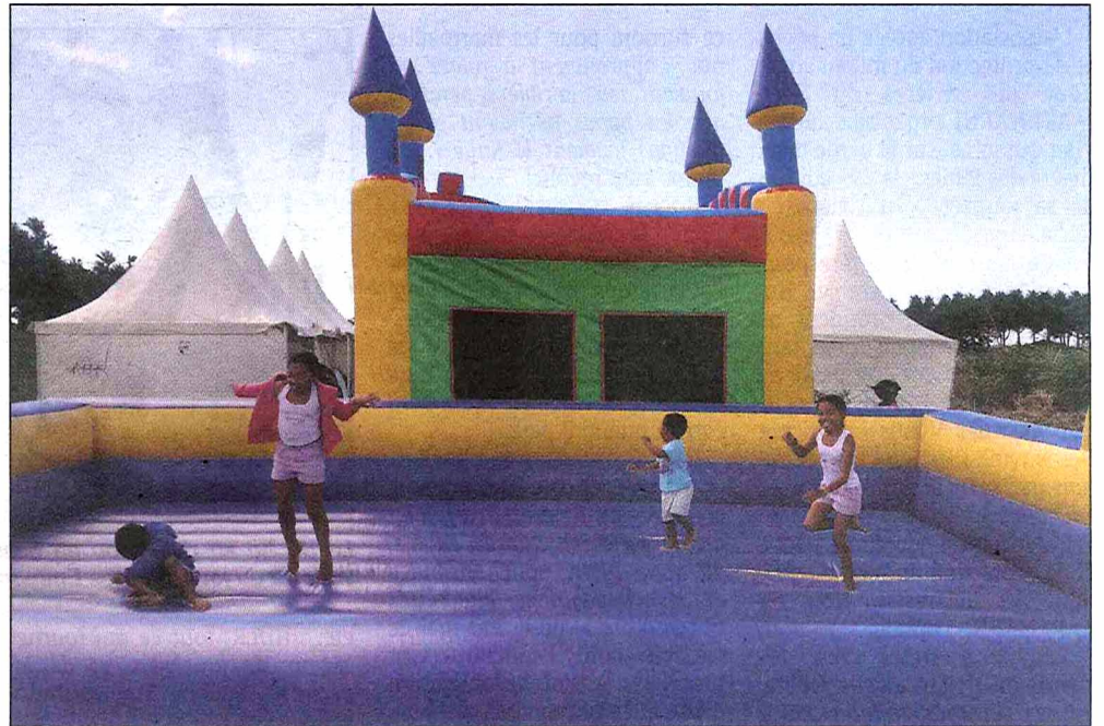
De nombreuses animations sont prévues au Colosse durant les vacances dont des jeux gonflables pour les marmailles.

La première édition de « Couleurs vacances », le 19 août dernier, avait attiré près